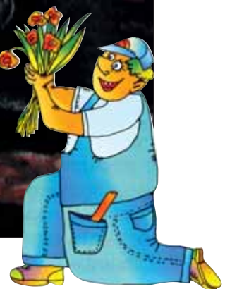
Рис. В. Черникова

Зато у нас были друзья. Мы выходили из дома и находили их. Мы катались на великах, пускали спички по весенним ручьям, сидели на лавочке, на заборе или в школьном дворе и болтали, о чём хотели.