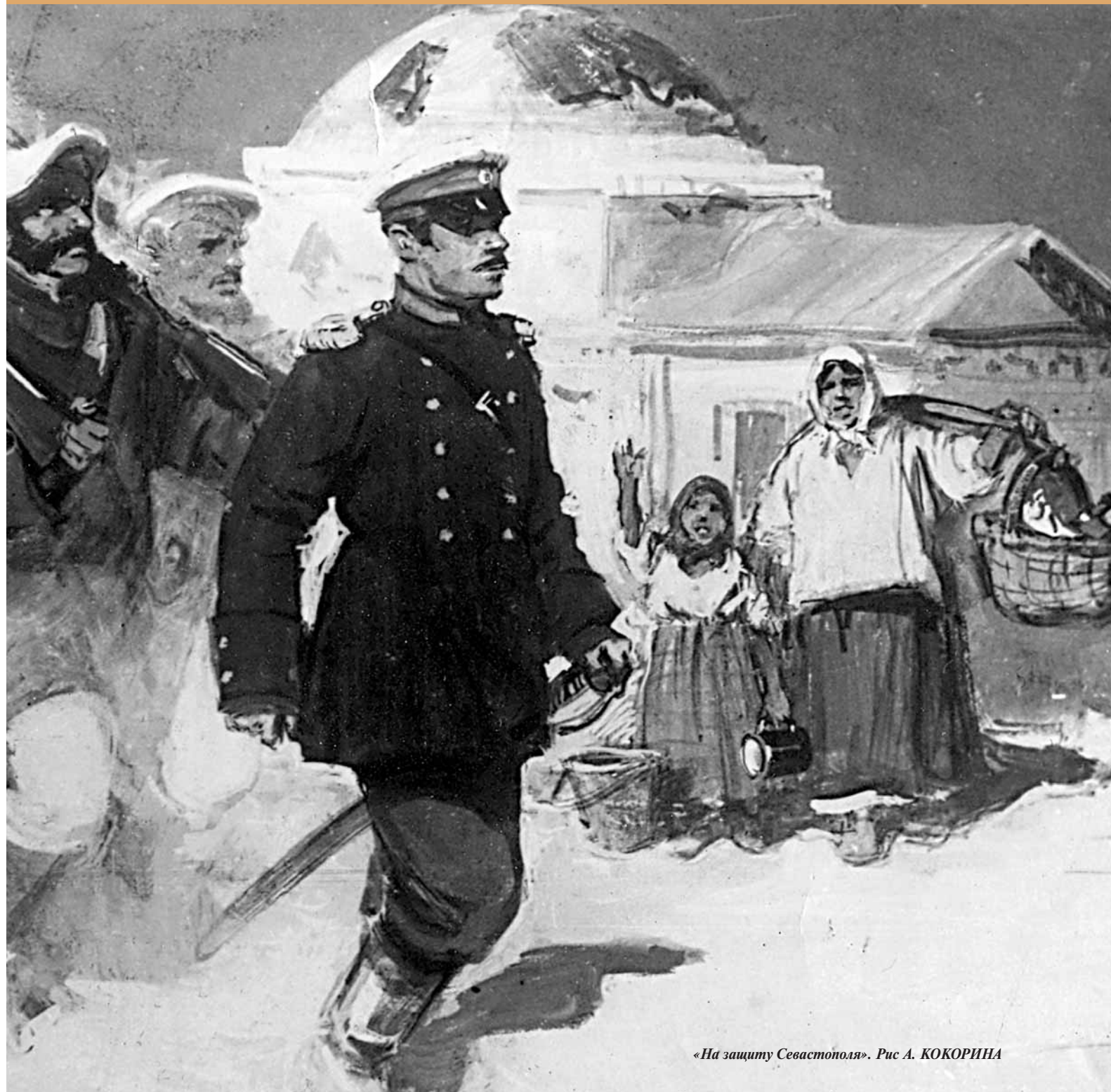
«На защиту Севастополя». Рис А. КОКОРИНА

«Как сегодня помочь великому городу? Как напомнить русскому человеку то, что он в сегодняшней спешке и обрывания вековых нитей чуть было не позабыл город доблести и героизма русских моряков. Севастополю удалось выдержать беспрецедентную 349-дневную осаду в период Крымской войны и 250-дневную осаду во время Великой Отечественной. Ему было присвоено звание «Город герой». В переводе с греческого Севастополь означает «величественный, достойный поклонения, героический город». Своё имя он оправдал славой более чем двухвековой истории».